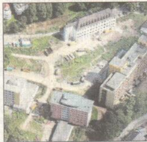
Fünf Klinikgebäude müssen den „Hohfuhr Terrassen“ weichen.

LÜDENSCHIED • 90 000 Kubikmeter umbauten Raums werden zu 20 000 Kubikmeter Mineralien, wenn der Abbruch der Klinikbauten an der Hohfuhrstraße vollzogen ist. Ein ungeahntes Problem gab es indes: Weil die Mobilfunkantenne auf der Kinderklinik bis Dezember strahlen muss, kann das Gebäude nicht gesprengt werden. Der Zeitplan soll aber gehalten werden. → 1. und 3. Lokalseite